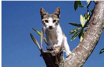
Les propriétaires de Noël, encore chaton sur notre photo, l'avaient perdu en 2010 après leur arrivée de Tahiti.