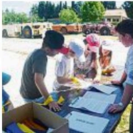
L'accueil des enfants au musée.

Pour la première fois, les parents ou grands-parents sont invités